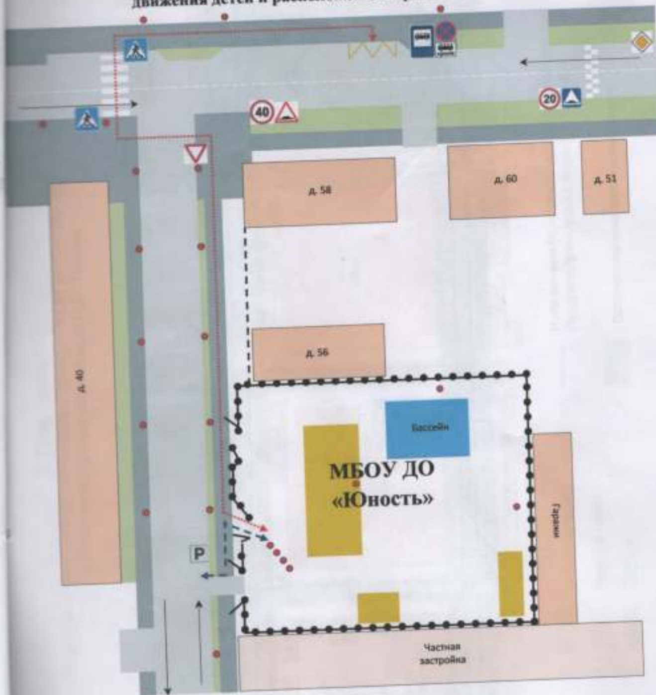
Схема организации дорожного движения в непосредственной близости от МБОУ ДО «Юность» с размещением соответствующих технических средств, маршруты движения детей и расположение парковочных мест