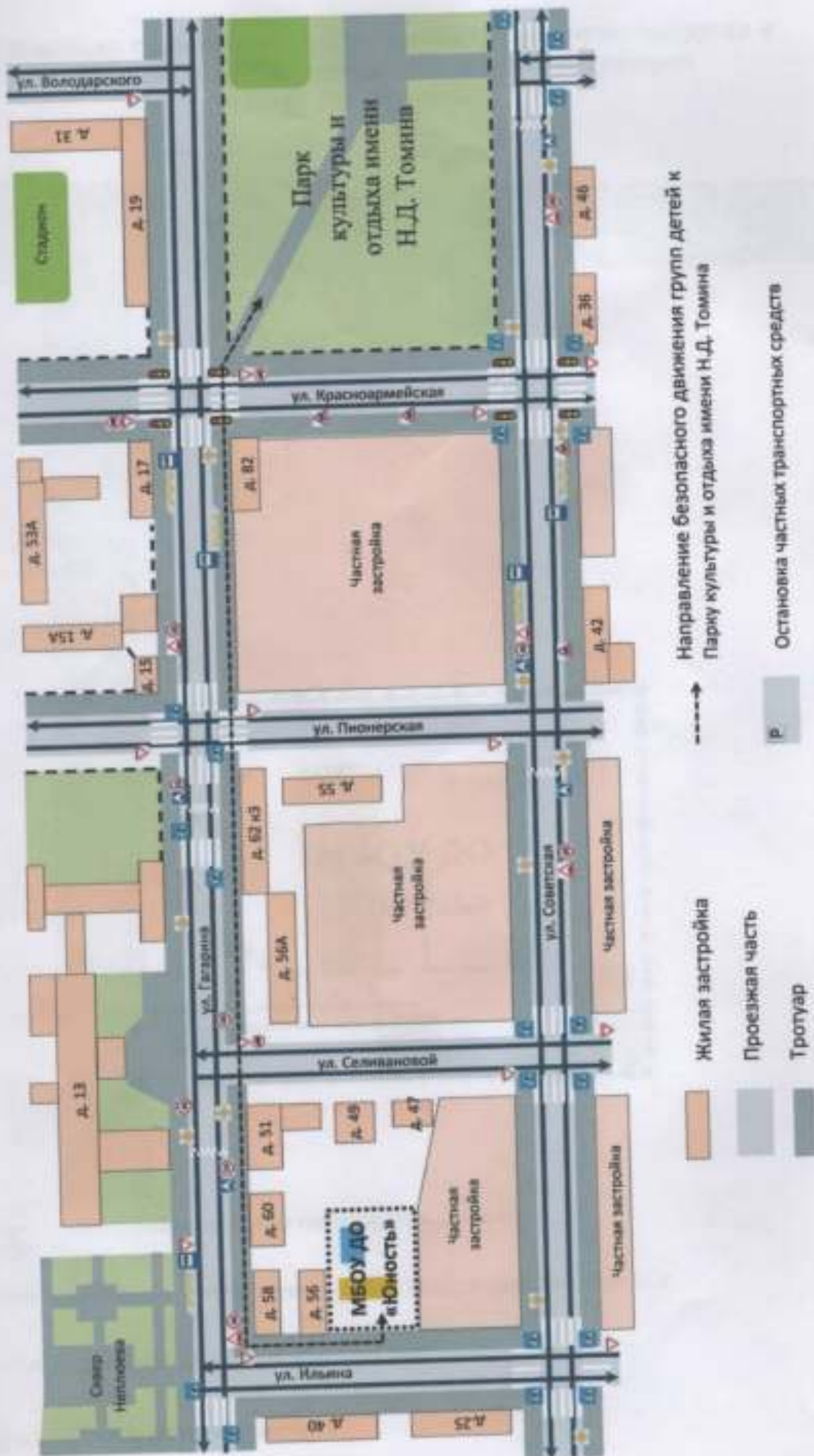
I. План – схема ОО Маршруты движения организованных групп детей от МБОУ ДО «Юность» к Парку культуры и отдыха имени Н.Д. Томина